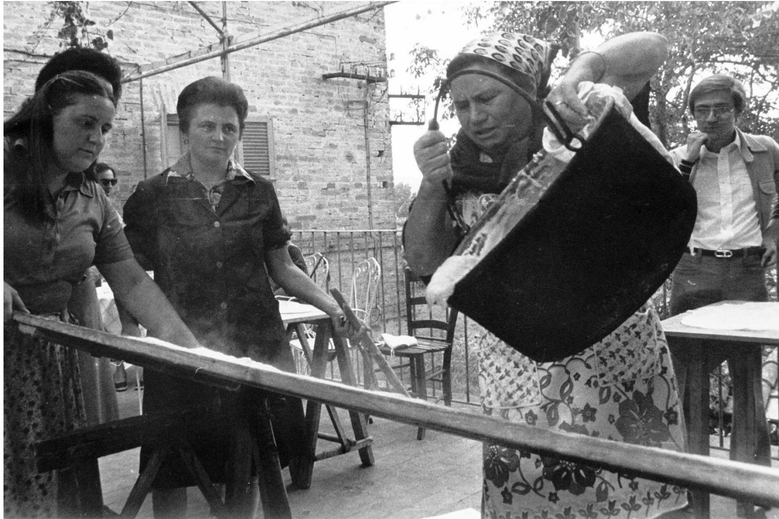
La polenta viene stesa sulla "spianatora"

Sambucheto - Anni '70