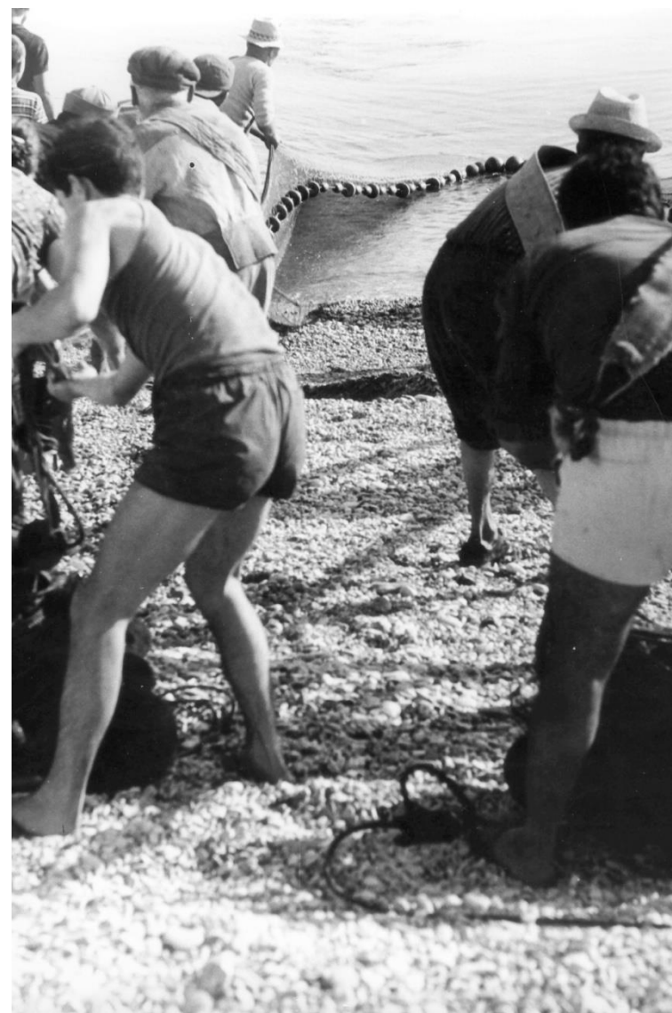
La sciabica Porto Recanati - Anni '50