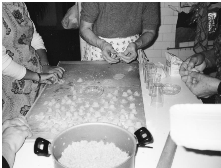
I cappelletti - Riempimento e chiusura Macerata - 1974 - Archivio privato