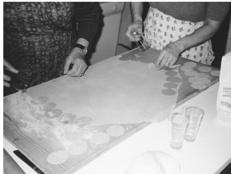
I cappelletti - Il taglio Macerata - 1974 - Archivio privato