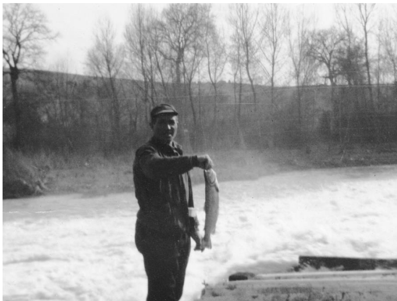
A pesca nel fiume Chienti Corridonia - 1963 - Archivio privato