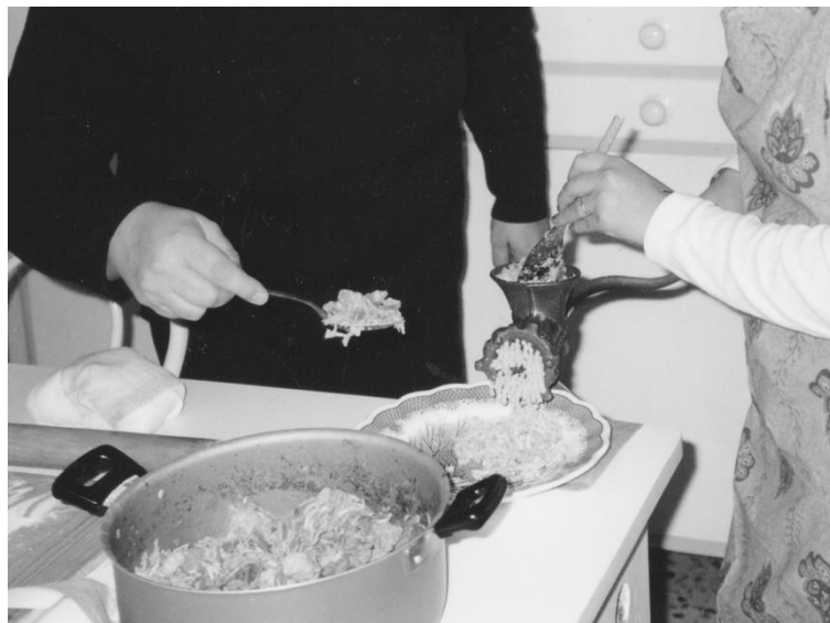
I cappelletti - Preparazione del ripieno Macerata - 1974