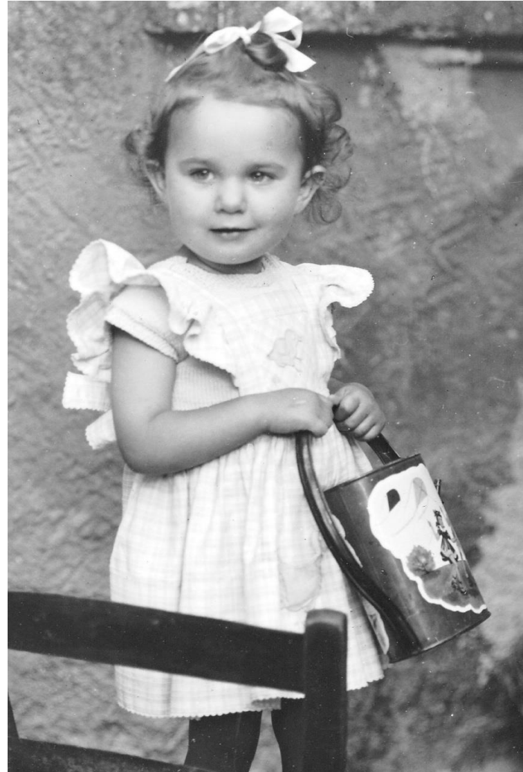
Anaffiatoio di latta Macerata - 1956