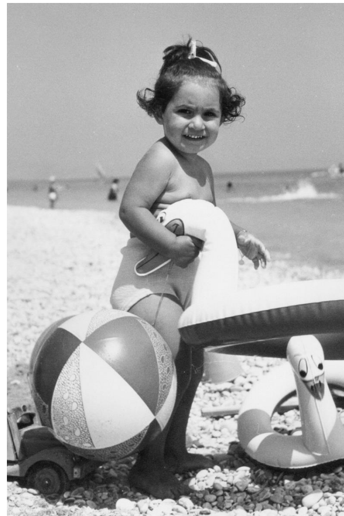
E' arrivata la plastica! Porto Recanati - 1957