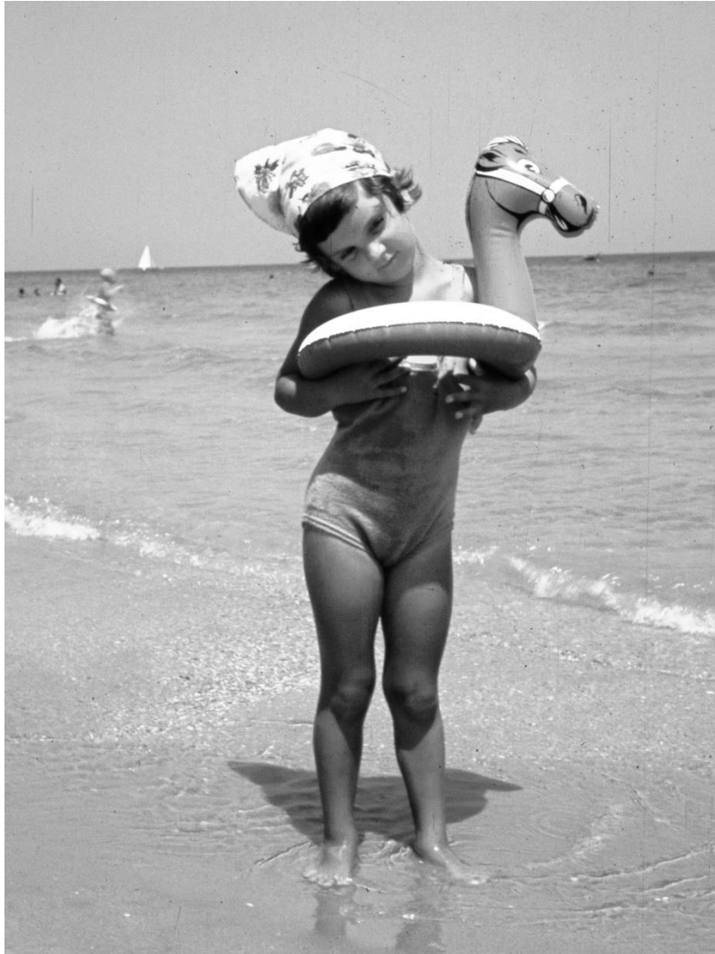
Mi sento sicura con la mia ciambella Porto Potenza - 1958