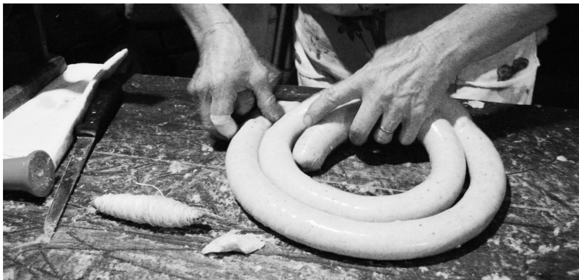
La "pista" - Il budello riempito è pronto per essere legato per ottenere le salsicce Campagna maceratese - Anni '70