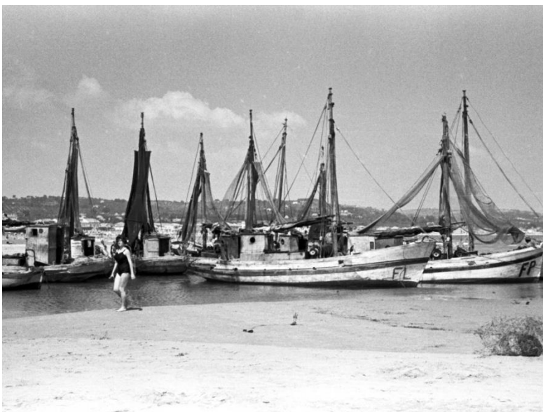
Pescherecci Civitanova - Anni '50