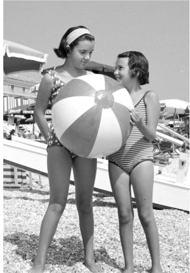
Vogliamo giocare? Porto Recanati - 1964