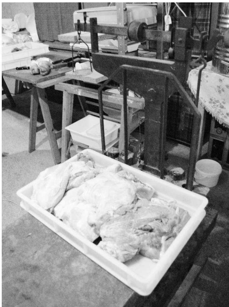
La "pista" - Pesata della carne sulla bascula Campagna maceratese - Anni '70