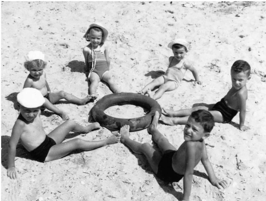
Una camera d'aria per ciambella! Civitanova - 1951

Conservare il ricordo... ...di quando non c'era la plastica