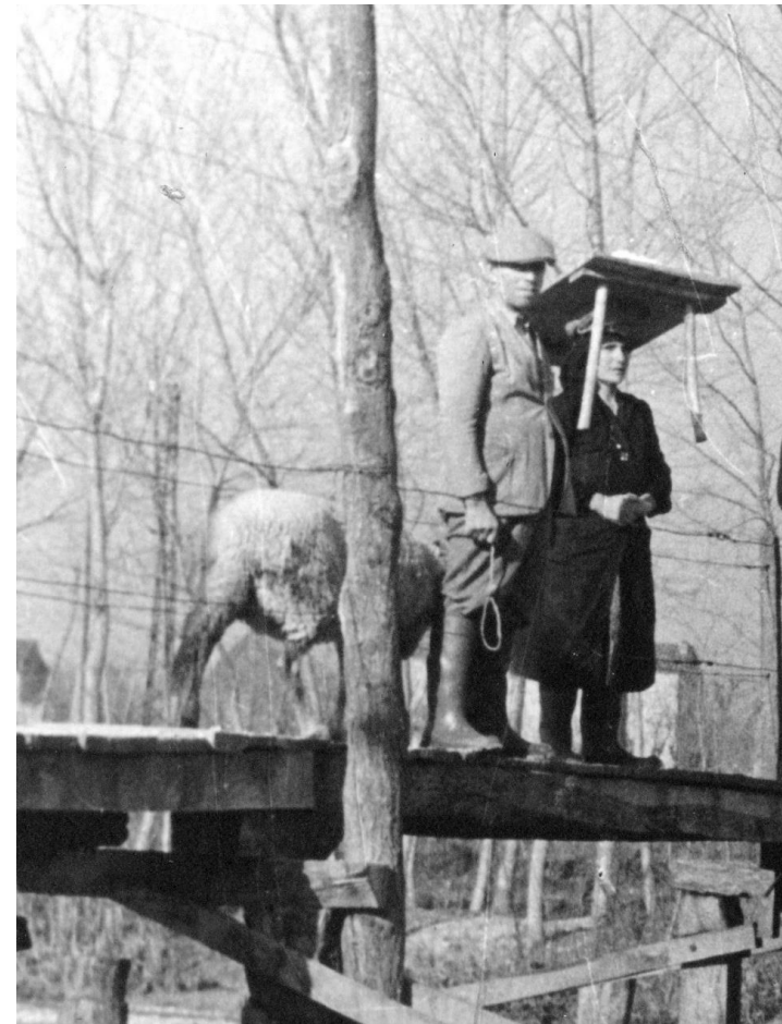
Lavandaia al fiume Potenza

Con il loro bidone su ruote, gli "scopini" passavano per le case, preannunciati dal suono della loro trombetta, e raccoglievano l'immondizia "porta a porta". Macerata - 1956