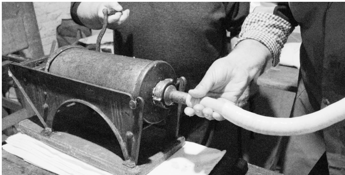
La "pista" - Insaccatura del macinato all'interno del budello Campagna maceratese - Anni '70