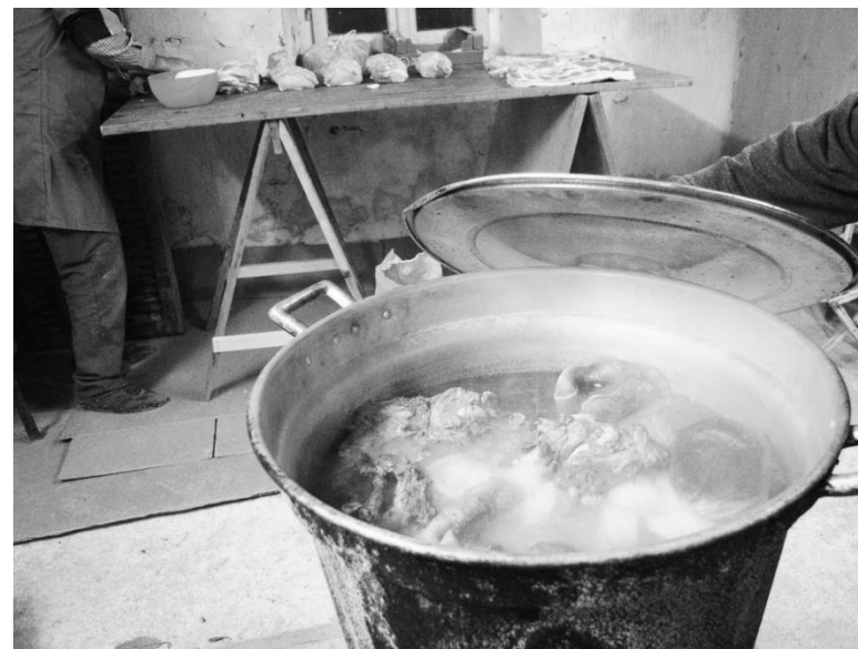
La "pista" - Bollitura della carne per la preparazione della coppa Campagna maceratese - Anni '70