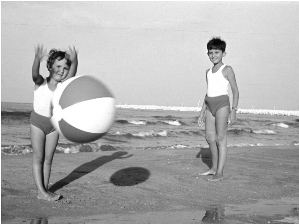
La leggerezza della plastica Civitanova - 1958 - Archivio privato

Conservare il ricordo... ...di quando è arrivata la plastica