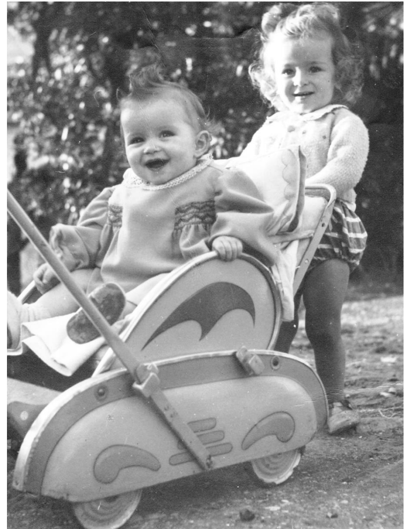
Passeggino di metallo Macerata - 1949