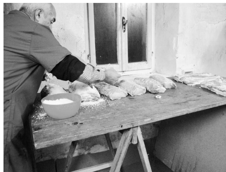
La "pista" - Salatura della carne per la sua conservazione Campagna maceratese - Anni '70