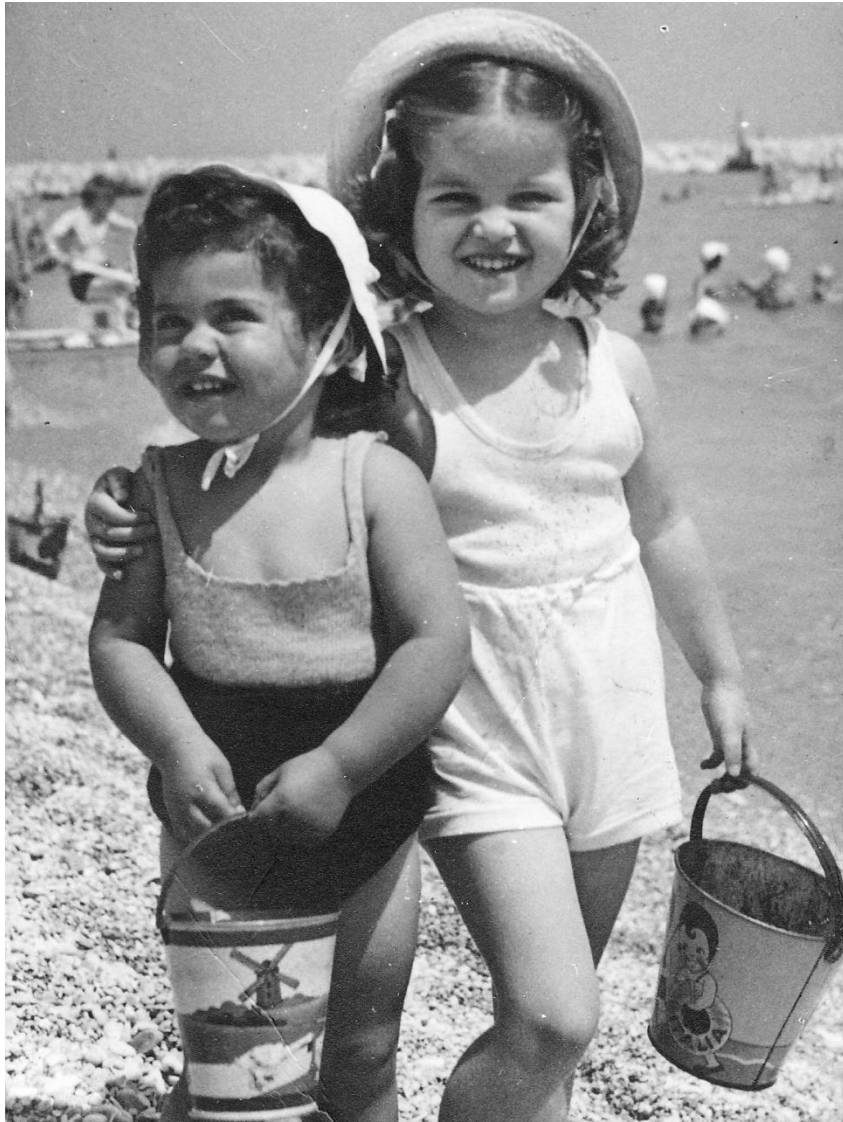
Secchielli di metallo Civitanova - 1952