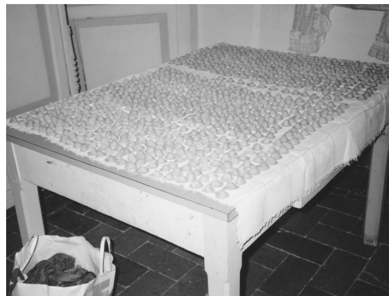
I cappelletti - Essiccazione e conteggio Macerata - 1974