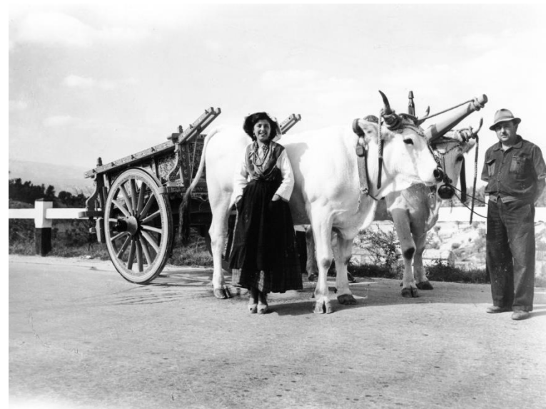
Biroccio con donna in costume da festa

Accanto a delle foto che testimoniano la trasformazione del concetto di agricoltura, ci piace mostrare anche delle immagini emblematiche di un'epoca, quella della mezzadria, in cui il tenore di vita della famiglia contadina , molto basso se paragonato a quello di una famiglia cittadina , veniva improvvisamente innalzato da un acquisto "speciale", come ad esempio una Fiat 1100.