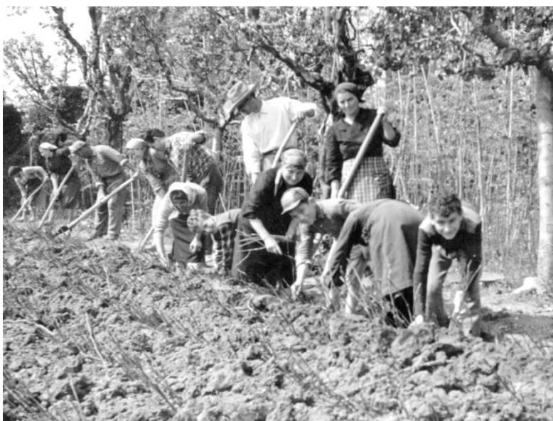
Piantagione di talee di vite

Negli anni '60 l'impiego di animali per l'aratura sopravviveva solo in particolari tipi di terreno. - Campagna Maceratese -1961