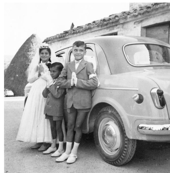
Set fotografico con Fiat 1100 - foto 5 Campagna maceratese - 1955