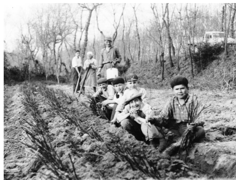
Piantagione a mano

Sambucheto (Macerata) - 1961