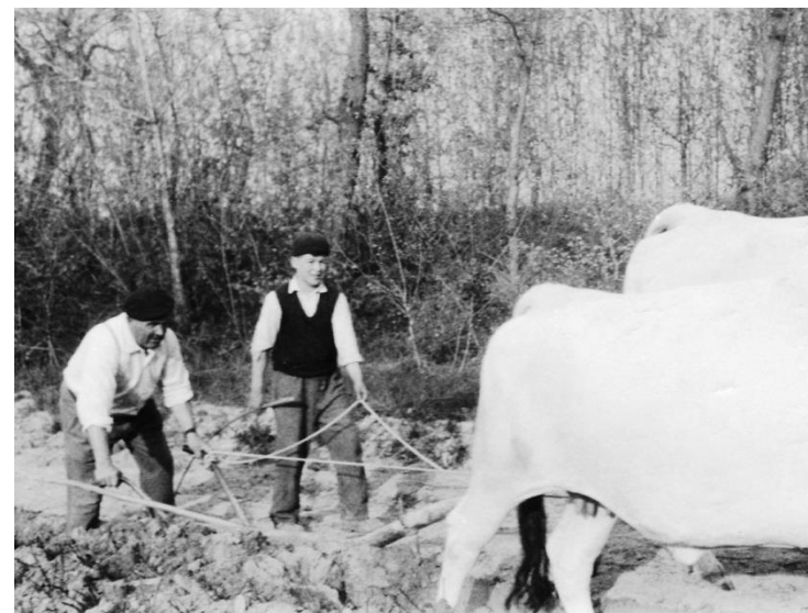
Aratura con i buoi su sabbione

Campagna maceratese - 1945