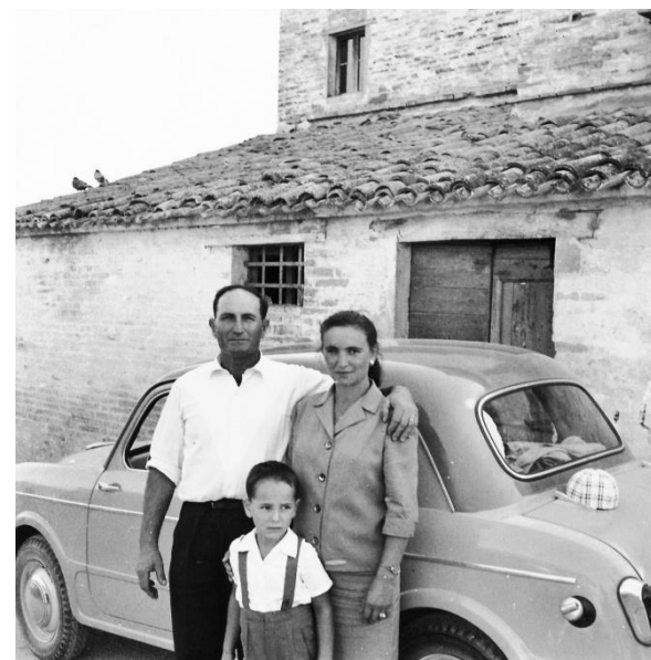
Set fotografico con Fiat 1100 - foto 7 Campagna maceratese - 1955