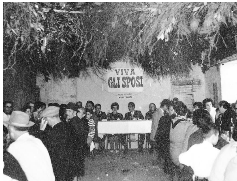
Matrimonio in Campagna

Macerata - 1948