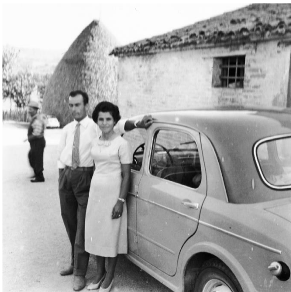
Set fotografico con Fiat 1100 - foto 4 Campagna maceratese - 1955