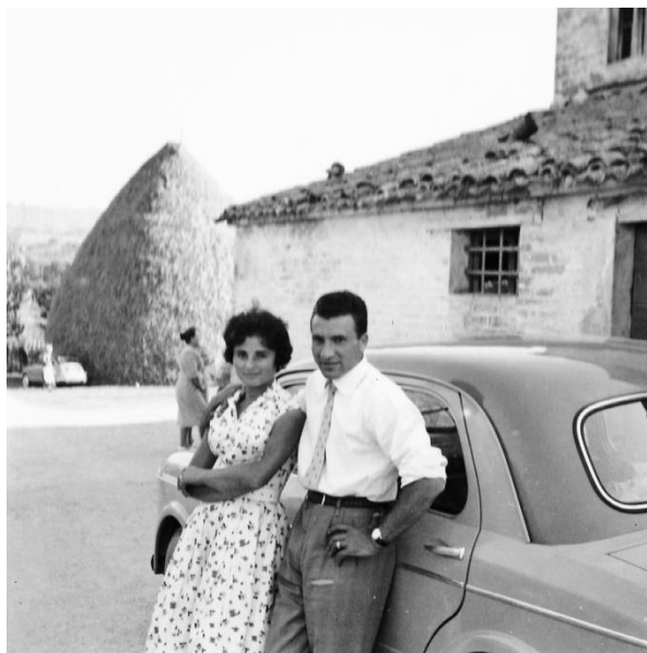
Set fotografico con Fiat 1100 - foto 6 Campagna maceratese - 1955